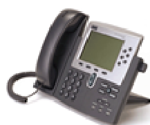
Cisco Systems serie 7960