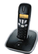
DECT Matra 530

Nous sommes maintenant votre unique interlocuteur et vous ne recevez qu'une seule facture, sans surprise en optimisant vos coûts.