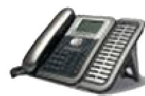
Thomson ST 2030